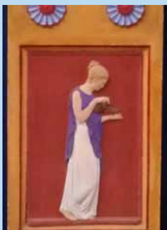
Relieffet på gravstenen viser en af de fem kloge jomfruer på vej for at modtage brudgommen, mens hun holder olie i sin lampe (fra en af Jesu lignelser).

Det kan vi desværre ikke. Farverne er for længst taget af vind og vejr. Men stenen med Friends smukke relief kan vi stadig nyde på kirkegården i Kundby.