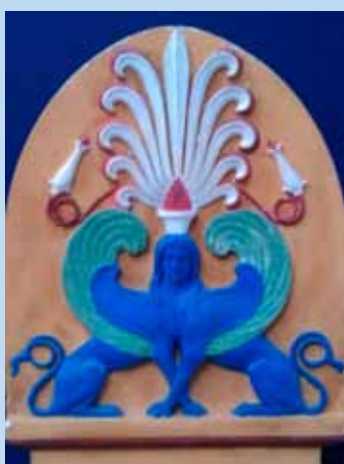
Øverst på stenens forside er en dobbelt sphinx, men kun med et hoved. Høyen fortolker den som sindbilledet på ”den ubekendte gaadefulde Tilværelse hinsides Graven”.