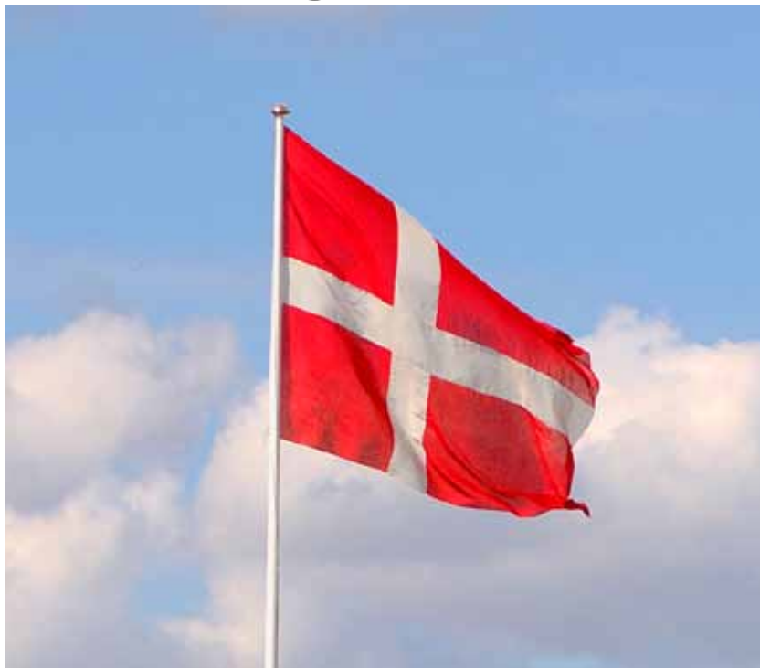
Det traditionelle grundlovs møde i Stigs Bjergby præstegårdshave holdes i år med Naser Khader som hovedtaler. Vel mødt d. 5. juni.