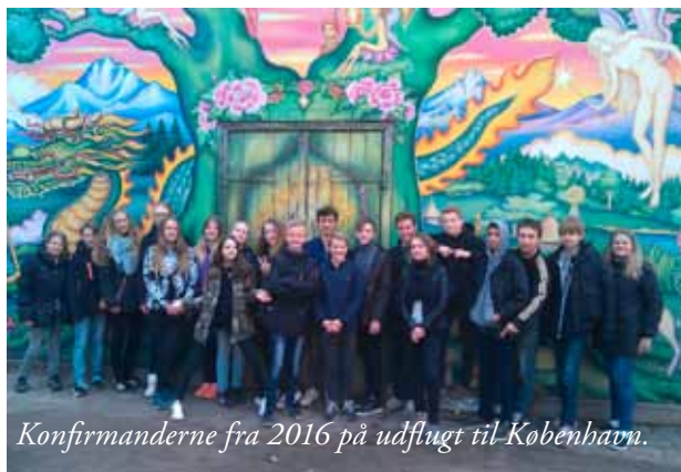
Konfirmanderne fra 2016 på udflugt til København.

I Kundby åbner vi en strikkecafé i løbet af september. Det kommer til at foregå i præstegårdens konfirmandstue et par aftner om måneden. Strik, snak