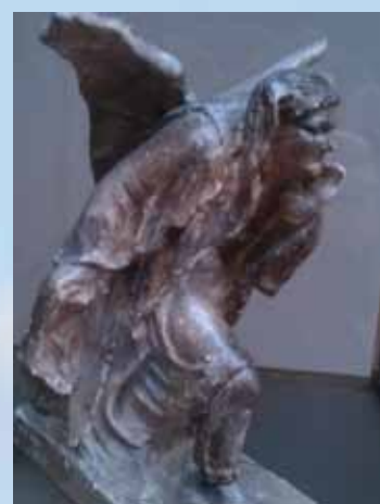
Freund var også optaget af den nordiske mytologi. Denne fantastiske statuette af Loke, hvor skadefryden lyser ud af hans ansigt, står på Glyptoteket.