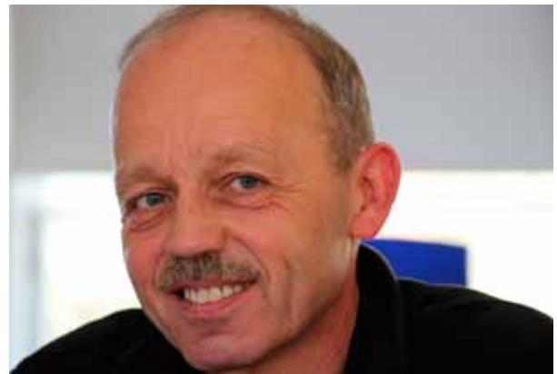
Jack er ansat som graver. Foto: Asbjørn Hansen.