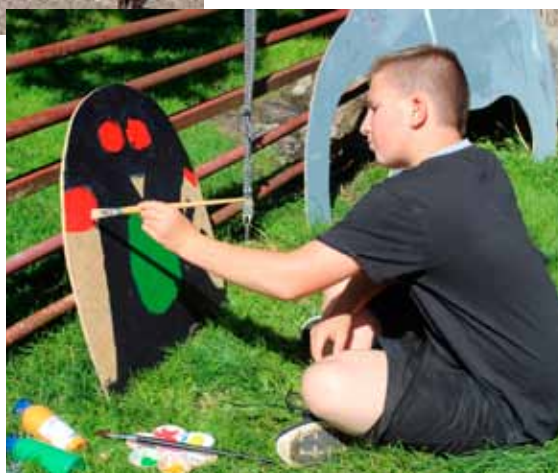
Billeder fra Sommerkirken 2015.