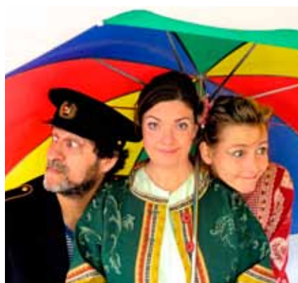
TRIOfabula opfører Noahs Ark i Hjembæk Kirke d. 12. september.

Arrangementet er et samarbejde mellem Støtteforeningen til Hjembæk Forsamlingshus og Hjembæk-Svinninge Menighedsråd.