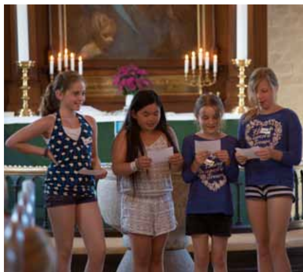
Underholdning eller indhold? Sommerkirken 2015.