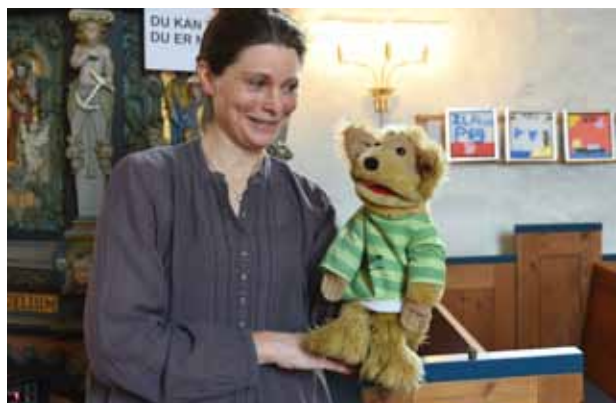
Snapper medvirker på familielørdag 19. marts.