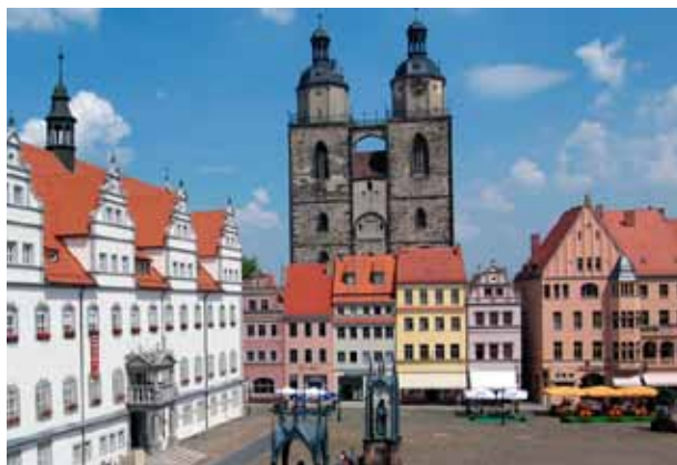
I 2017 arrangeres der jubilæumstur til Lutherbyerne i Tyskland, bl.a. til Wittenberg.

3. maj: Tur til Wartburg, borgen, hvor Luther opholdt sig, da han var lyst fredløs, og hvor han bl.a. oversatte Bibelen til tysk. Efter frokost i Eisenach udflugt til det smukke Thüringer Wald.