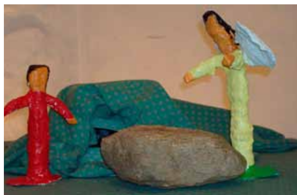
Englen ved den tomme grav. Lavet af Kundby minikonfirmander.