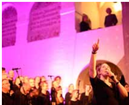
5. marts spiller Gospel Unlimited i Skamstrup Kirke.

Gospel Unlimited er et ambitiøst, uhøjtideligt og energisk gospelkor fra Nørrebro, der tæller op til 50 sangere, som på tværs af seks stemmegrupper formår at levere koncerter som spreder smil og energi i flere kilometers radius.